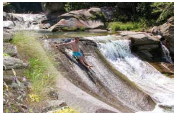
Le toboggan près de Pianascio di Fuori dans le Val d'Osola

Ces quatre bassins de l'Osura sont situés les uns en dessous des autres, entre d'énormes rochers hauts et plats. Ce lieu se démarque par son toboggan naturel de deux mètres de long. Le bassin inférieur se situe juste sous la passerelle suspendue.