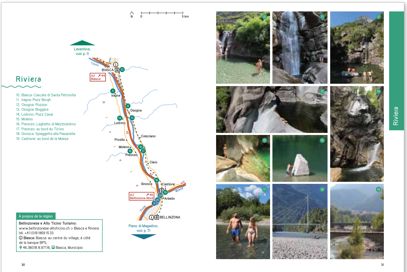
13 Dans les gorges de la Boggera près d'Osogna, voir p.42 sq.

Dans cette région, les cours d'eau ont sculpté les plus belles gorges du Tessin. Dans ce décor escarpé, chaque bassin se déverse dans le suivant. Mais on trouve également, dans cette région, de paisibles plages fluviales.