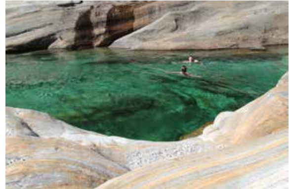
Le Pozz di Vacch à Lavertezzo

Ce bassin de la Verzasca s'étend sur 80 mètres et est bordé par des rochers arrondis aux tons gris et orange. Vous pouvez vous y allonger et vous en servir pour plonger.